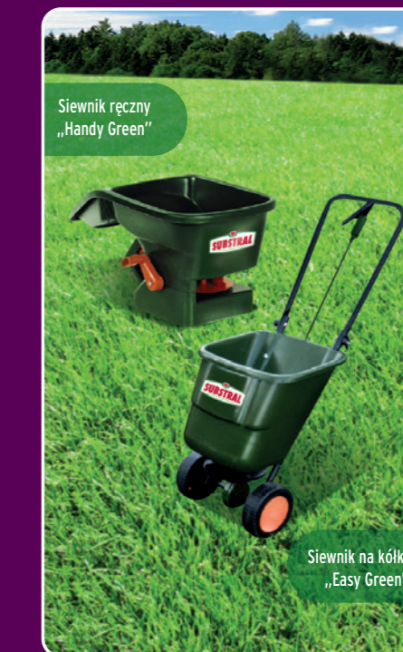
Siewnik ręczny „Handy Green”

Aby równomiernie nawozić trawnik, polecamy stosowanie siewników z rozrzutnikiem do dużych powierzchni.